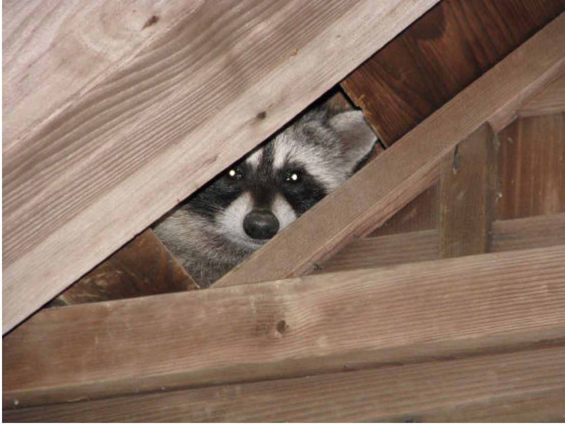
寺の軒から下を見るアライグマ