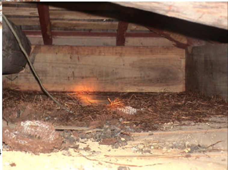
屋根裏で子育て ムササビの巣を乗っ取って利用