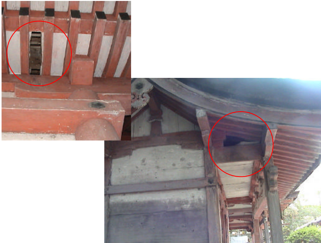
アライグマが侵入のために開けた穴