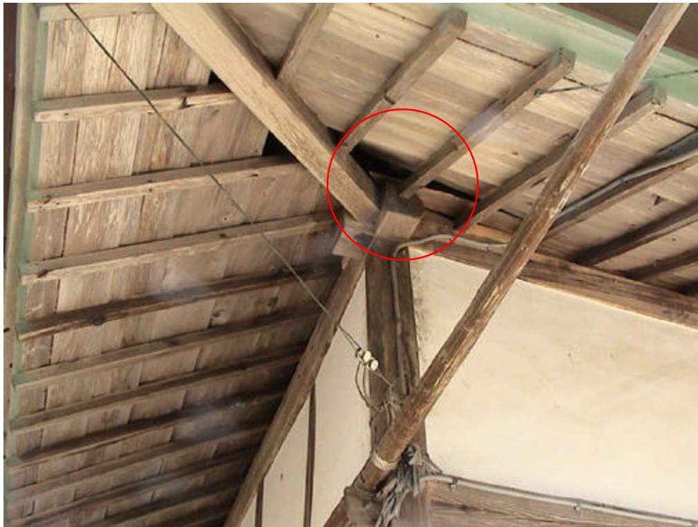
上、下ともアライグマが出入りのために開けた穴