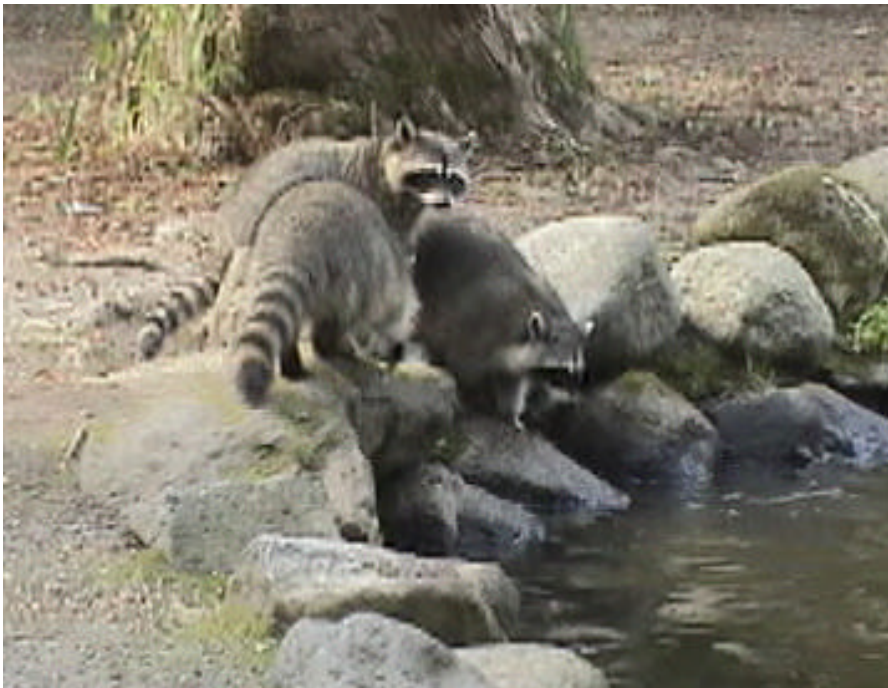
カナダのアライグマ家族