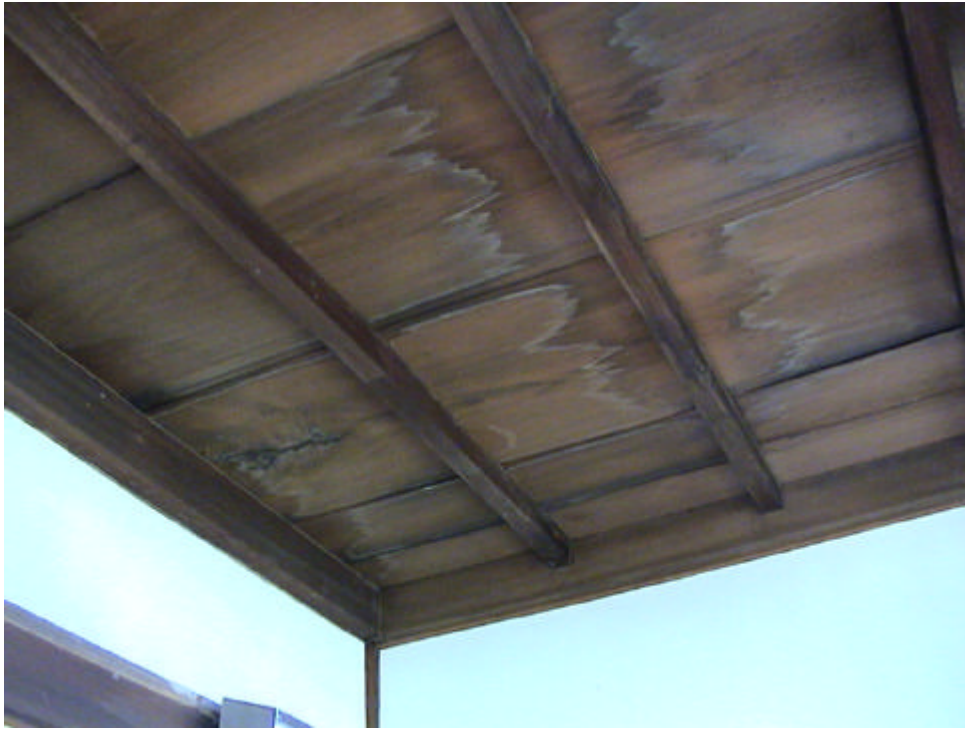
アライグマの尿によるシミ