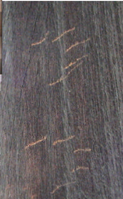
清水寺 重要文化財 朝倉堂 足跡と爪痕